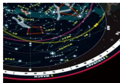
イメージ写真は過去の実施の内容です。